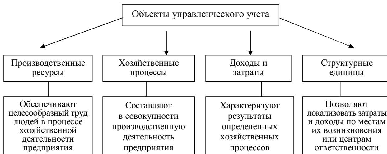
Рис. 1. Виды объектов управленческого учета

К первой группе объектов управленческого учета относятся: