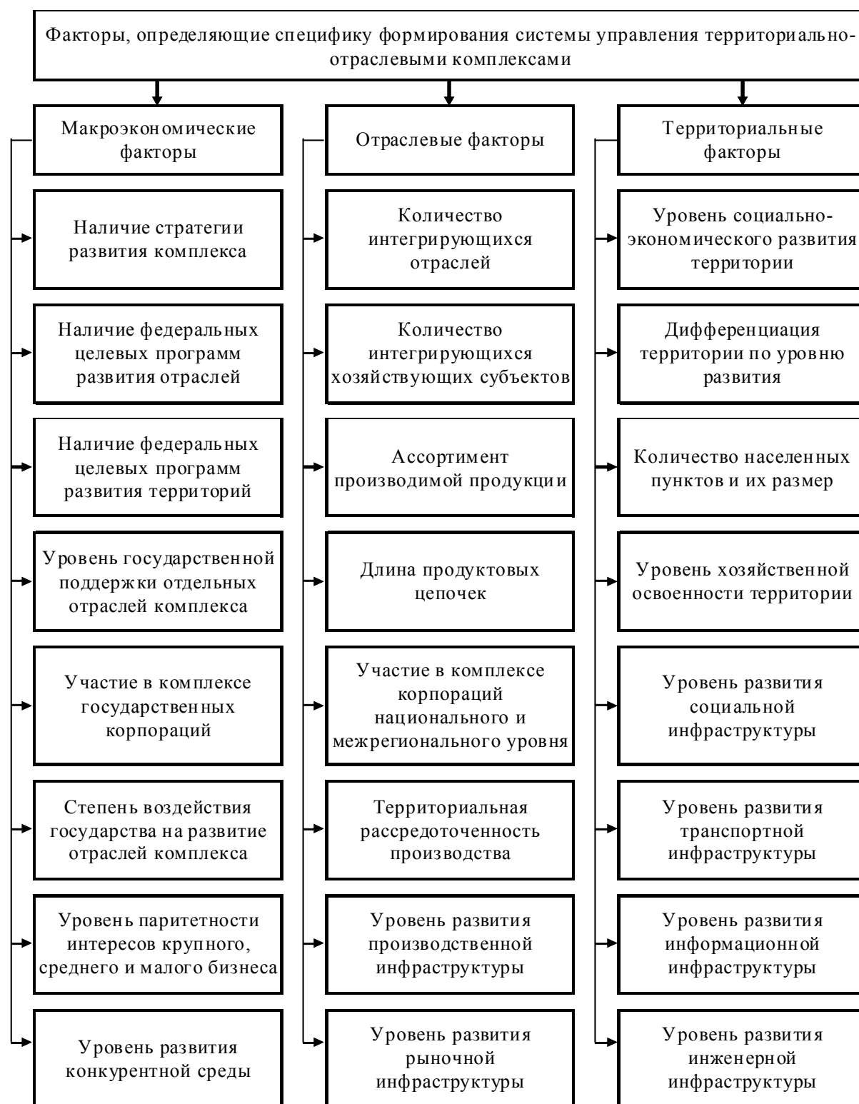
Рис. 2. Факторы, определяющие специфику формирования системы управления территориально-отраслевыми комплексами

Специфика формирования системы управления территориально-отраслевым комплексом определяется, в первую очередь, непосредственным участием государства в его развитии через принятие государственной стратегии развития комплекса, федеральных программ развития отдельных отраслей и территорий, уровнем их государственной поддержки, участием в комплексе государственных корпораций, степени воз-